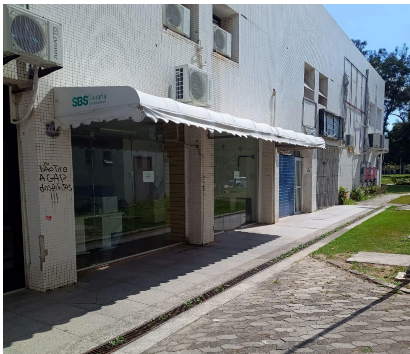
Figura 1 - Fachada do local de funcionamento do SIC/Ouvidoria da Ufes.