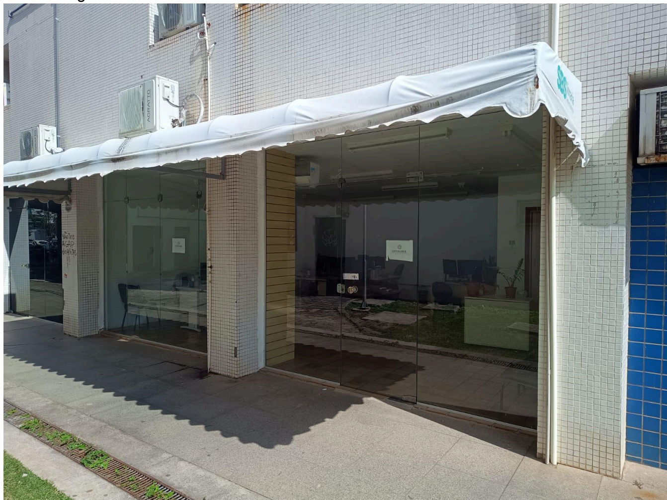
Figura 3 - Fachada do local de funcionamento do SIC/Ouvidoria da Ufes.