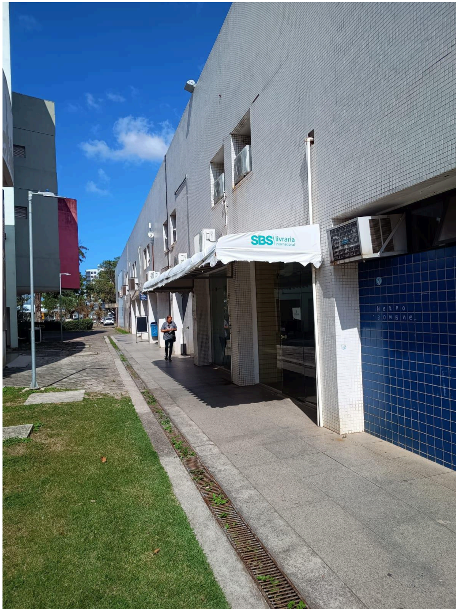
Figura 2 - Fachada do local de funcionamento do SIC/Ouvidoria da Ufes.