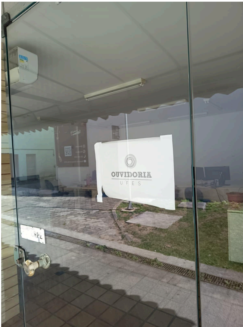
Figura 4 - Porta de entrada do local de funcionamento do SIC/Ouvidoria da Ufes.