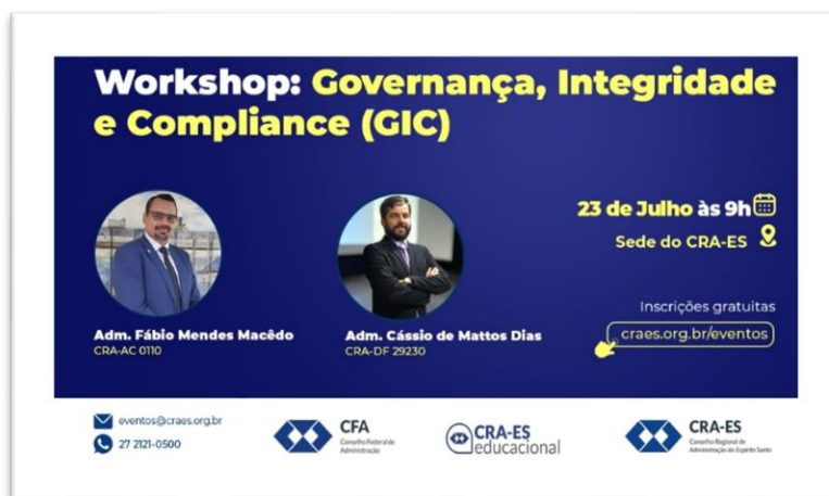
Figura 2. Card de divulgação do Workshop