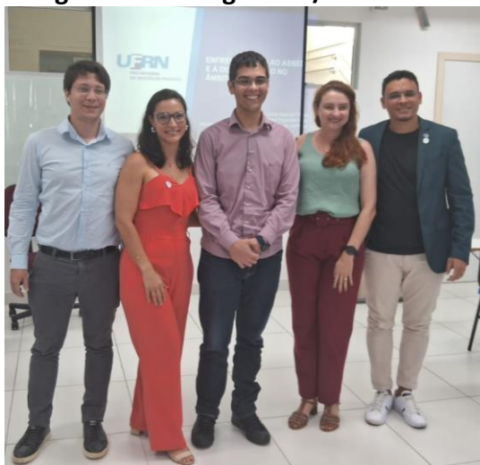
Figura 11. Corregedoria/UFRN