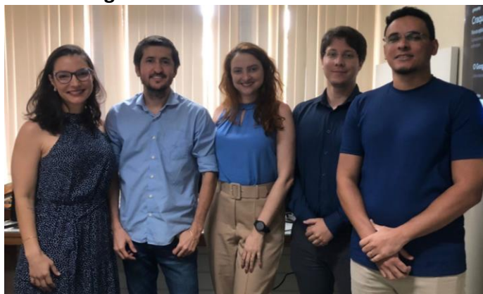
Figura 10. Auditoria Interna UFRN