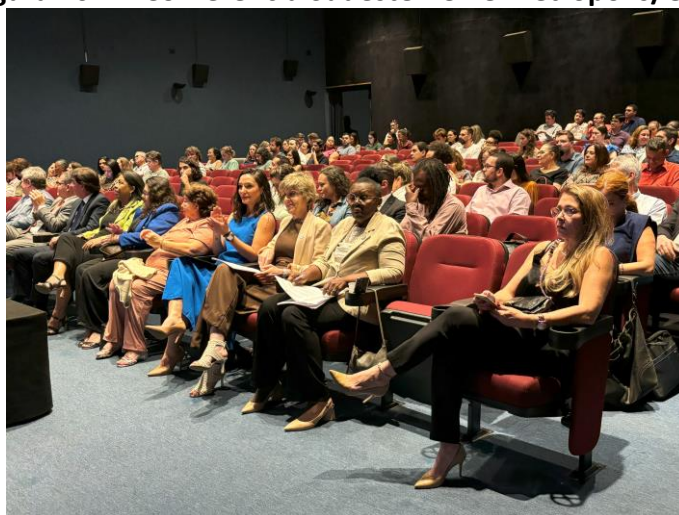
Figura 20. 1ª Conferência Sudeste - Cine Metrópolis/Ufes