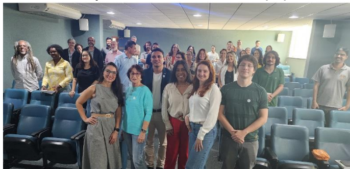
Figura 15. Encontro presencial interlocutores(as) Vitória e Alegre