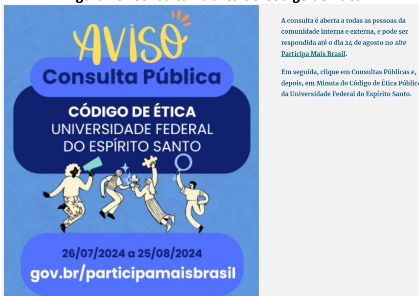
Figura 23. Consulta Pública do Código de Ética