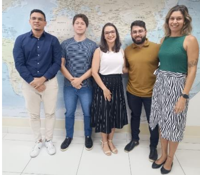
Figura 7. Secretaria de Gestão de Projetos/UFRN