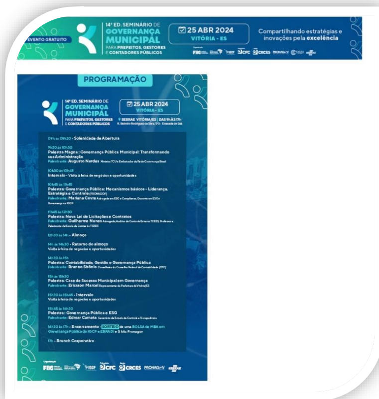
Figura 1. Programação do 14º Seminário de Governança Municipal