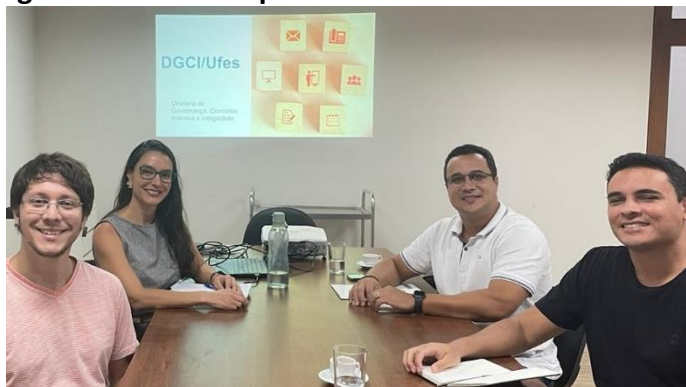
Figura 14. Encontro presencial interlocutor do Ceunes

Em 2024, a DGCI promoveu encontros presenciais com os(as) interlocutores(as) de Governança de Vitória, Alegre e São Mateus e divulgou ações de capacitação promovidas pela DDP/Progep sobre tema relacionado ao escopo do Programa. As figuras a seguir mostram os registros desses encontros: