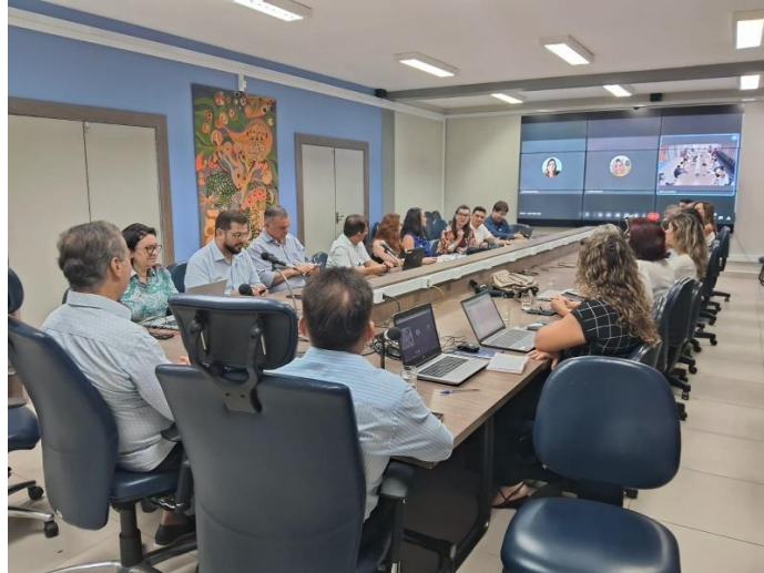
Figura 4. Reunião com o Comitê de Governança Estratégica/UFRN