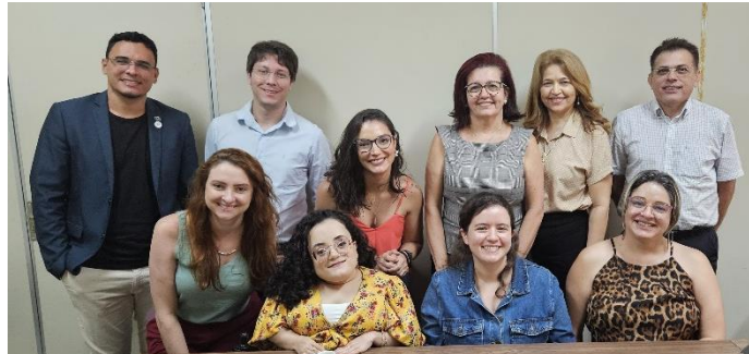
Figura 8. Ouvidoria e Secretaria de Governança Institucional/UFRN