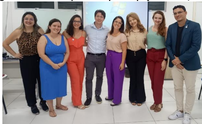
Figura 9. Núcleo responsável pelo Espaço Acolher/UFRN