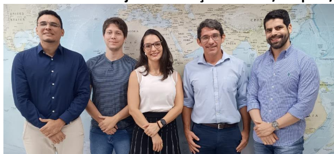
Figura 12. Equipe da Diretoria de Contabilidade e Finanças (DCF/UFRN) e Coordenadoria de Planejamento Orçamentário/Proplan/UFRN