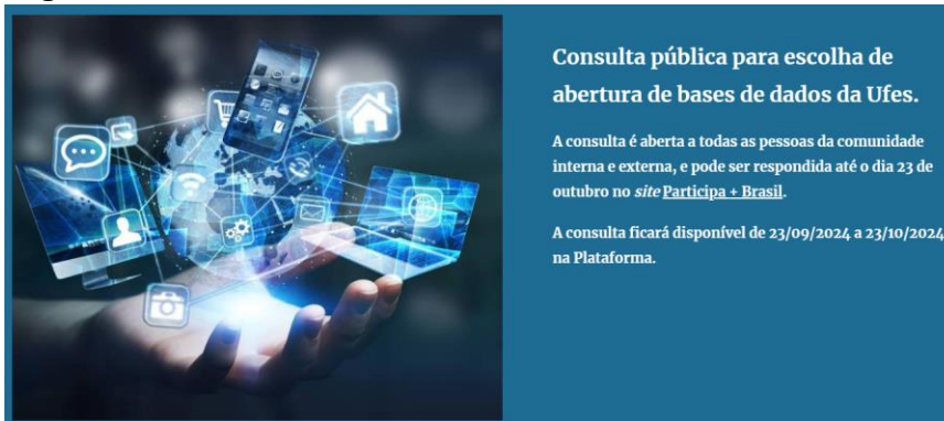
Figura 24. Consulta Pública Abertura de Bases de Dados da Ufes