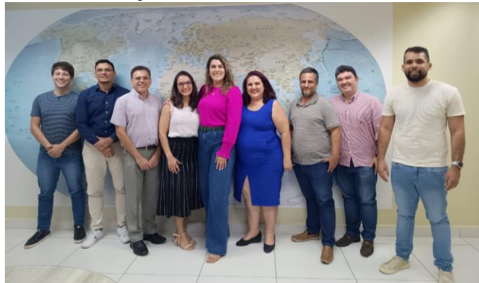
Figura 5. Unidades de Proteção de Dados Pessoais e de Gestão de Riscos/UFRN