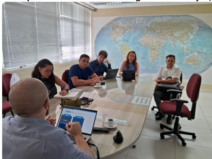
Figura 6. Superintendência de Tecnologia da Informação/UFRN