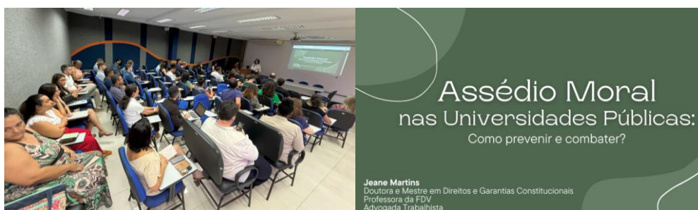
Figura 21. Palestra e oficina sobre assédio moral - auditório da BC/Ufes